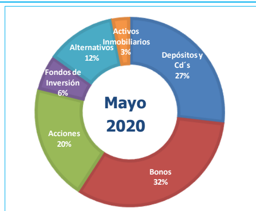
Gráfico N°2: Composición por Instrumento del Portafolio FCR