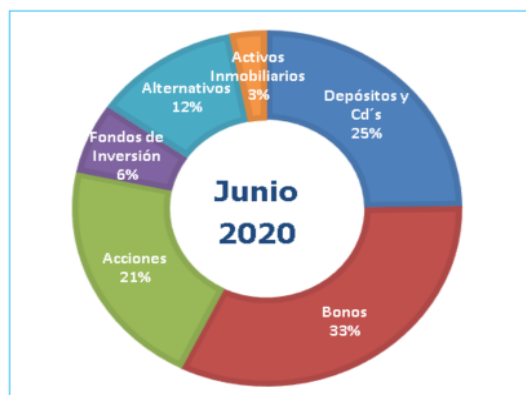
Gráfico N°2: Composición por Instrumento del Portafolio FCR