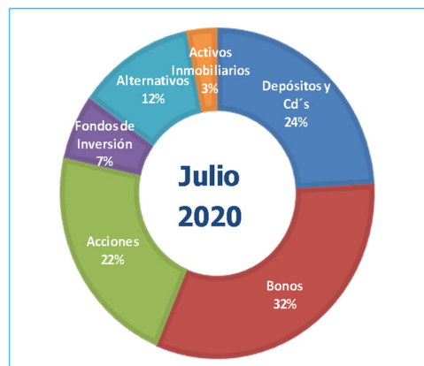
Gráfico N°2: Composición por Instrumento del Portafolio FCR