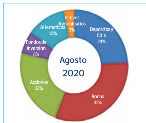
Gráfico N°2: Composición por Instrumento del Portafolio FCR (expresado a valor contable)