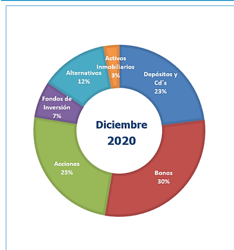
Gráfico N°2: Composición por Instrumento del Portafolio FCR (expresado a valor contable)