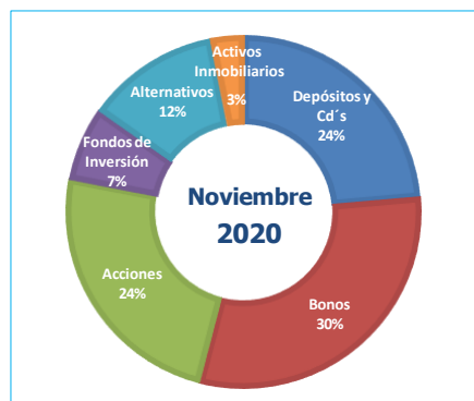
Gráfico N°2: Composición por Instrumento del Portafolio FCR (expresado a valor contable)